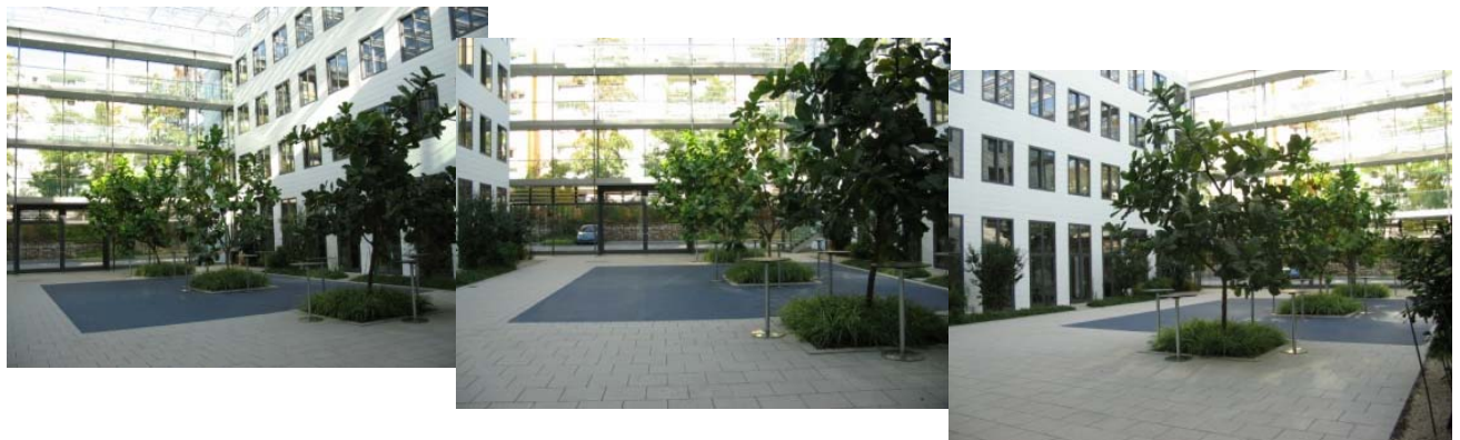
Ausstellungsfläche im überdachten Atrium des Fraunhoferzentrums

Das Fraunhofer-Zentrum bietet mit seinem großen, direkt gegenüber dem Vortragsraum gelegenen Atrium den idealen Rahmen für die Firmenausstellung. Die Ausstellungsflächen werden übersichtlich angeordnet sein und bieten jedem Aussteller optimale Präsentationsmöglichkeiten. Um den regen Austausch zu ermöglichen, werden auch die Kaffeepausen und der Firmenabend hier stattfinden.